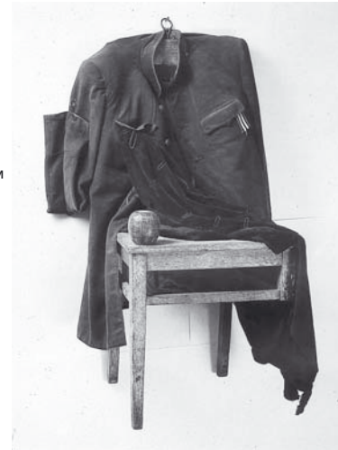
В. Воинов. Свидание после войны, 1985.

Авторская галерея, экспозиция которой создана отделом новейших течений Государственного Русского музея и институтом «Pro Arte» и посвящена новейшей истории России, представленной функциоколажами Вадима