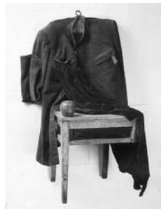
В.Воинов Свидание после войны, 1985

Авторская галерея, экспозиция которой создана с.н.с. Государственного Русского музея Ириной Карасик и посвящена новейшей истории России, представленной функциоколлажами Вадима Воинова. Кураторы – Ирина Карасик и Евгений Орлов